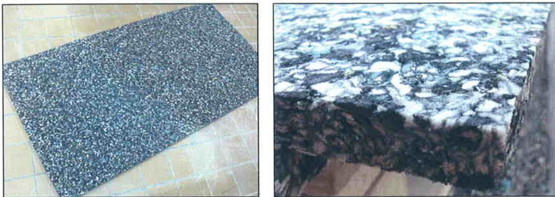
Imágenes 1 y 2 Detalles del panel Copopren ® Acústico Negro de 20 mm

Para la construcción de la muestra se utiliza un conjunto de paneles de espuma de poliuretano aglomerada Copopren ® Acústico Negro de 20 mm de espesor y densidad nominal 150 Kg/m 3 . Estos paneles son realizados mediante inyección especial de polvo granulado de poliuretano y tamizado selectivo (descripción aportada por el peticionario del ensayo). Las dimensiones nominales de los paneles son 2000 x 1000 mm. Material recibido el 2 de marzo de 2009.